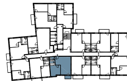
schéma pôdorysu 4. NP / scheme of the fourth floor