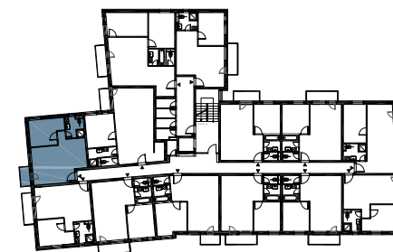
schéma pôdorysu 4. NP / scheme of the fourth floor