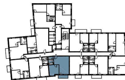
schéma pôdorysu 5.NP / scheme of the fifth floor