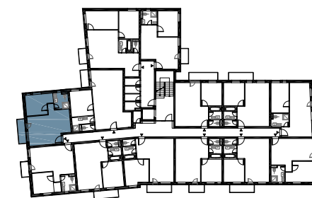
schéma pôdorysu 5. NP / scheme of the fifth floor