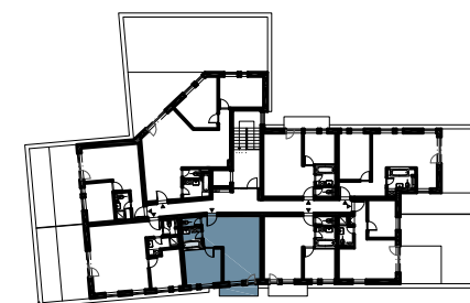
schéma pôdorysu 6. NP / scheme of the sixth floor